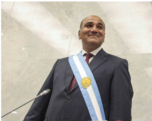
GOB. JUAN MANZUR EN SU DISCURSO DE ASUNCION DE MANDO 29 DE OCTUBRE DE 2015