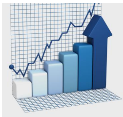
Población según deciles de ingreso per cápita familiar. Conclusión