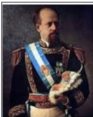
PTE. JULIO A. ROCA 1880-1886

“Todos los pueblos de la tierra... han sentido la necesidad de constatar metódicamente por medio de expresiones numéricas la multiplicidad de sus hechos sociales porque es únicamente con su auxilio que el espíritu del pensador puede medir el grado de adelanto a que ellos han alcanzado en todas las esferas del progreso de la sociabilidad humana”.